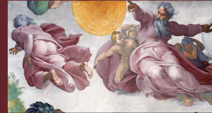
Creazione degli astri e delle piante

Sette è invece il numero che segnala la perfezione delle opere di Dio: la settimana della creazione come «cosa buona» si completa infatti solo col sabato. Anche nel libro di Giosuè le mura di Gerico crollano dopo una processione di 7 giorni.