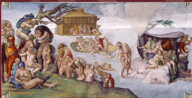
Diluvio universale Michelangelo 1510 - Cappella Sistina - Città del Vaticano

Sono gli anni di una generazione e dunque il tempo necessario per un cambiamento, una conversione radicale. Per questo il Diluvio universale si prolunga 40 giorni e 40 notti (è il passaggio a un'umanità nuova) e gli israeliti soggiornano 40 anni nel deserto.