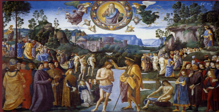
Il Battesimo di Cristo

Il numero 1 è la cifra della divinità per eccellenza: Dio è unico. «Ascolta, Israele, il Signore è nostro Dio, il Signore è uno» (Dt 6,4)