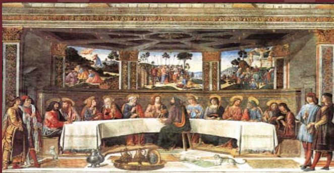
Ultima Cena Cosimo Rosselli 1481-82 - Cappella Sistina - Città del Vaticano

È la cifra che sta a significare la scelta del Signore, il numero dell'elezione: le 12 tribù d'Israele, i 12 apostoli... Per estensione, è il numero che designa il popolo di Dio (dell'Antico e del Nuovo Testamento) nella sua totalità.