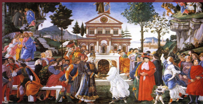
Le tentazioni di Cristo

Il simbolo della Trinità (Padre, Figlio e Spirito Santo). Ma anche le tre tentazioni che Gesù subisce da parte del diavolo nel deserto e che indicano i principali rischi dell'uomo: potere, ricchezza, fama.