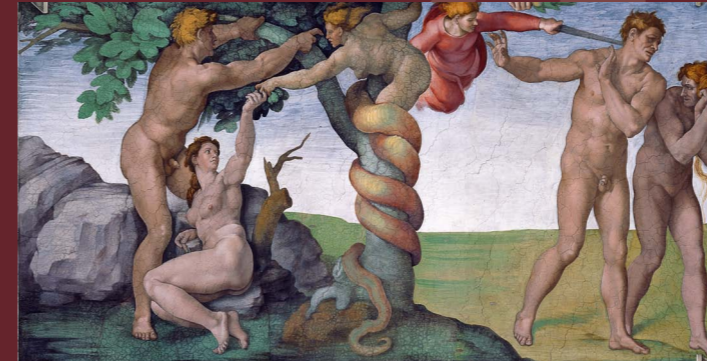
Peccato originale e Cacciata dal Paradiso Terrestre