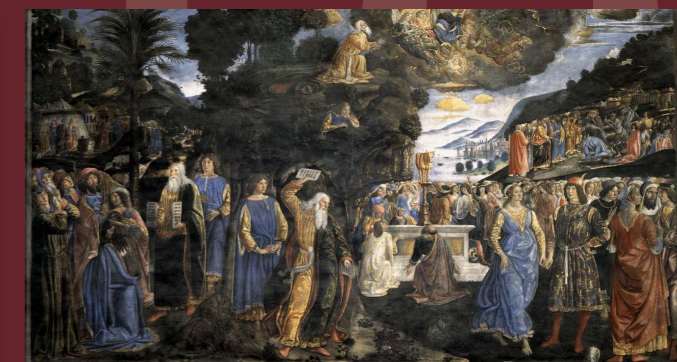
Consegna delle tavole della Legge

10 come le piaghe d'Egitto (Es 7-12), 10 come gli antenati che stanno fra Adamo e Noè e fra Noè e Abramo (Gn 5)... Soprattutto 10 come i comandamenti dati da Dio a Mosè (Es 20,1-17): da ricordare contandoli sulle dita delle mani.